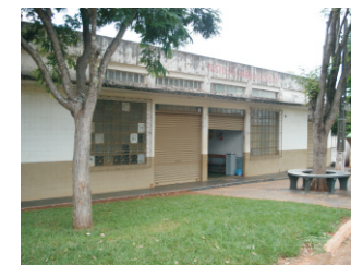
Unidade Básica de Saúde Localização: Avenida Carvalho, s/n