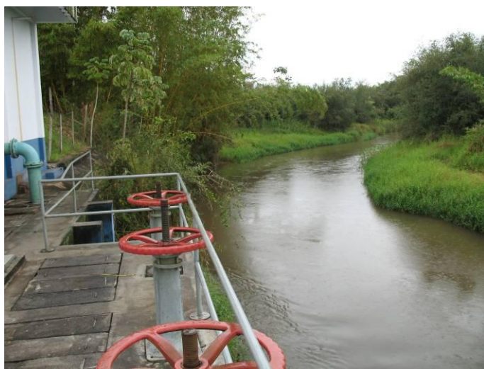
Fig. 6.1.1.2 – Comportas da estação de captação do Rio Xambrê