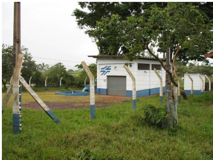
Fig. 6.1.1.3 – Estação elevatória e recalque para os reservatórios

O volume de reserva é determinado pelos três reservatórios que atendem a cidade na sua totalidade sendo: