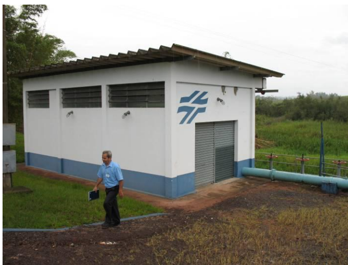
Fig. 6.1.1.1 – Estação de captação do Rio Xambrê

O abastecimento urbano de água de Iporã é realizado pelo Rio Xambrê (219.901; 7.346.412) 1 . A vazão varia entre 120 m 3 /h e 130 m 3 /h e o tratamento é realizado junto à estação de captação. A água é bombeada até uma estação elevatória intermediária (221.870; 7.344.269) 2 . Na seqüência a água é conduzida para três reservatórios, dois semi-enterrados e um elevado e, por último, distribuída por gravidade para toda rede urbana. Já nos distritos, o abastecimento é realizado por poços tubulares e o tratamento é automatizado e feito junto à captação com dosador de cloro. As figuras 6.1.1.1, 6.1.1.2 e 6.1.1.3 mostram a estação de captação do Rio Xambrê, as comportas da estação e a estação elevatória intermediária respectivamente.